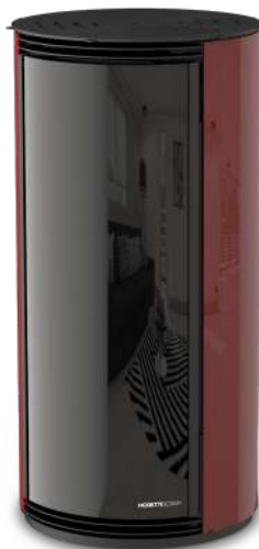
Bordeaux Bordeaux - Bordeaux Bordeaux - Bordeaux