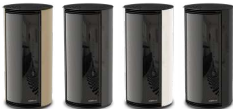
Champagne - Champagne Champagne - Champagner Champän - Champagner Canna di Fucile - Bronze à Canon Gunmetal - Rotguss Bianco - Bianco White - Blanc - Negro - Weiß Nero - Black - Noir - Negro - Schwarz