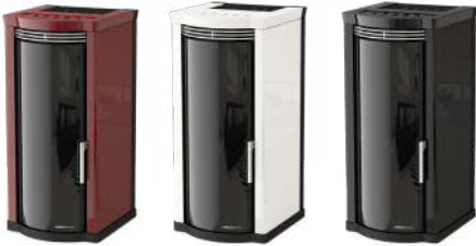
Bordeaux Bordeaux - Bordeaux Bordeaux - Bordeaux

2 Rear Outlets (2 Motors) - Front Ventilation (1 Motor) - Rear Exhaust Fume Outlet - 2 Salidas Traseras (2 Motores) - Ventilación Frontal (1 Motor) - Salida De Humos Trasera - 2 Sorties Arrière (2 Moteurs) - Ventilation Avant (1 Moteur) - Sortie De Fumée Arrière - 2 Ausgänge Hinten (2 Motore) - Front Gebläse (1 Motor) - Rauchausgang Hinten