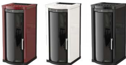
Bordeaux Bordeaux - Bordeaux Bordeaux - Bordeaux

Front Ventilation (1 Motor) - Rear Exhaust Fume Outlet - Ventilación Frontal (1 Motor) - Salida De Humos Trasera - Ventilation Avant (1 Moteur) - Sortie De Fumée Arrière - Front Gebläse (1 Motor) - Rauchausgang Hinten - Top Exhaust Fume Outlet - Salida De Humos Superior - Sortie De Fumée Supérieur - Rauchausgang Oben - Seitlicher Rauchausgang