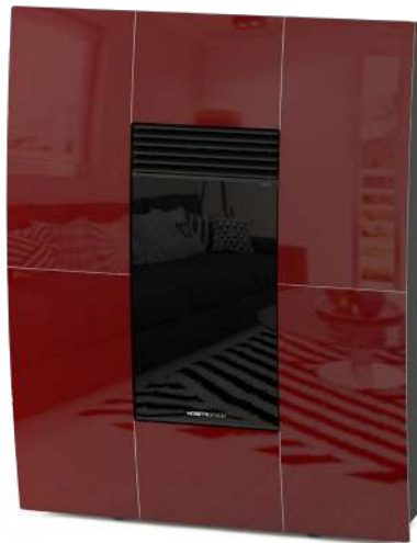
Bordeaux Bordeaux - Bordeaux - Bordeaux - Bordeaux

Ventilazione Frontale (1 Motore) - Uscita Fumi Superiore - Uscita Fumi Posteriore - Uscita Fumi Laterale