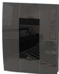
Canna di Fucile Gurmettal - Bronze à Canon Gunmetal - Rotguss