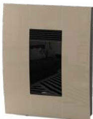
Champagne Champagne - Champagne Champän - Champagner