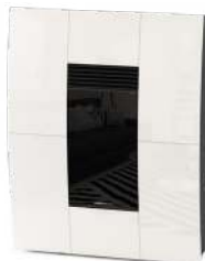
Bianco White - Blanc - Blanco - Weiß