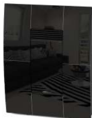
Nero Black - Noir - Negro - Schwarz

Potenza Globale Global Power Puisance globale Potencia global Verbrennungsleistung