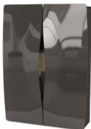
Canna di Fucile Gunmetal - Bronze à Canon Gunmetal - Rotguss