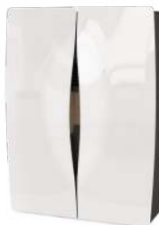
Bianco White - Blanc - Blanco - Weiß