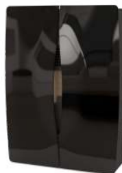
Nero Black - Noir - Negro - Schwarz

Potenza Globale Global Power Puissance globale Potencia global Verbrennungsleistung