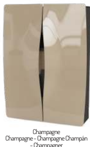
Champagne Champagne - Champagne Champän - Champagner