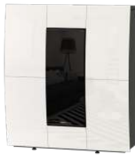
White - Blanc - Bianco - Weiß