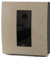
Champagne - Champagne Champán - Champagner