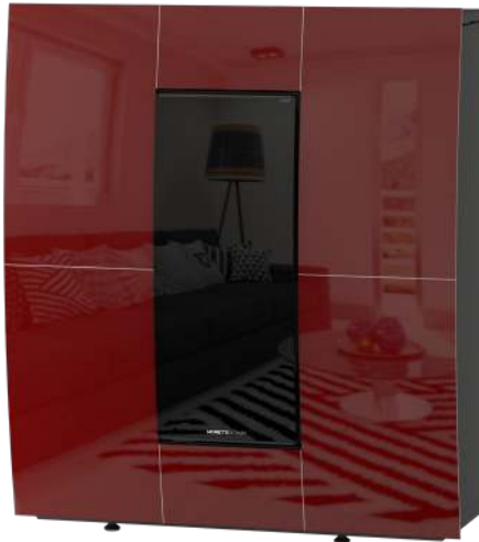
Bordeaux - Bordeaux - Bordeaux - Burdeos - Bordeaux

Top Ventilation - Rear Exhaust Fume Outlet - Side Exhaust Fume Outlet - Top Exhaust Fume Outlet - Ventilation Supérieur - Sortie De Fumée Arrière - Sortie De Fumée Latéral - Sortie De Fumée Supérieur - Ventilación Superior - Salida De Humos Trasera - Salida De Humos Lateral - Salida De Humos Superior - Gebläse Oben - Rauchausgang Hinten - Seitlicher Rauchausgang - Rauchausgang Oben