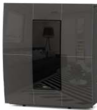
Gunmetal - Bronze à Canon - Gunmetal - Rotguss