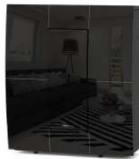
Black - Noir - Negro - Schwarz