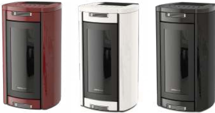
Bordeaux Bordeaux - Bordeaux Bordeaux - Bordeaux

2 Rear Outlets (2 Motors) - Front Ventilation (1 Motor) - Rear Exhaust Fume Outlet - 2 Salidas Traseras (2 Motores) - Ventilación Frontal (1 Motor) - Salida De Humos Trasera - 2 Sorties Arrière (2 Moteurs) - Ventilation Avant (1 Moteur) - Sortie De Fumée Arrière - 2 Ausgänge Hinten (2 Motore) - Front Gebläse (1 Motor) - Rauchausgang Hinten